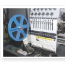
Kit lantejolas (opcional)