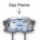
Bases para bonés