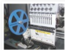
Kit lantejolas (opcional)