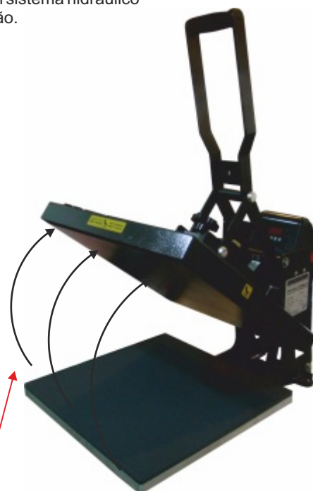
Abertura automática do tampo.